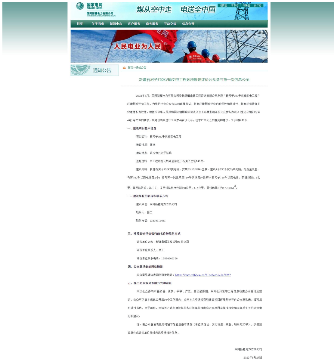
图 2.2-1 第一次网上公示

我单位在确定石河子 750 千伏输变电工程环境影响报告书编制单位后，通过网络平台（国网新疆电力有限公司网站）开展了本项目首次环境影响评价信息公开。见图 2.2-1。