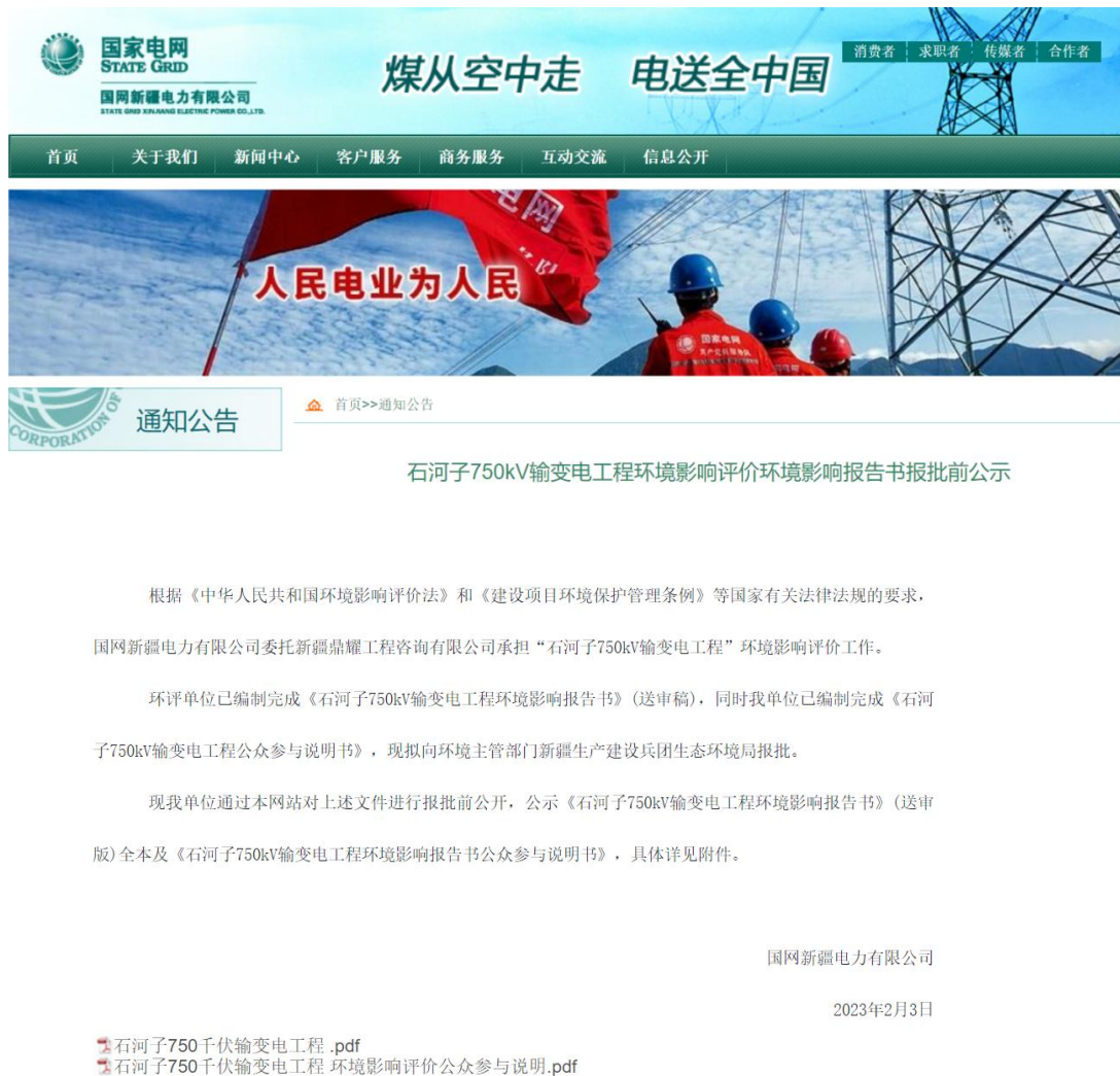
图 6.1-1 本项目拟报批前公开照片