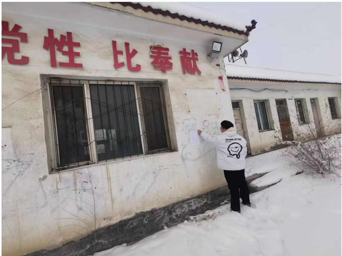
图 3.2-4 本项目张贴公告照片