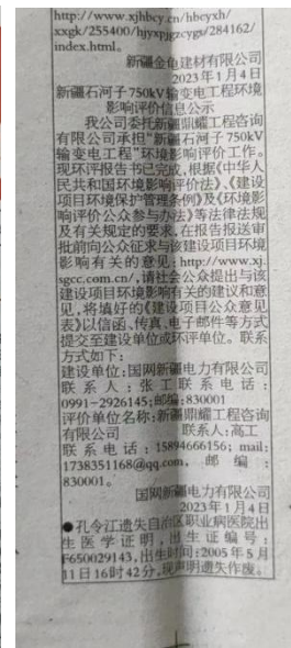
3.2-2 在新疆法制报发布本项目第二次环境影响评价信息